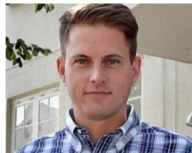
Jan Crone Foster Stormflodssikring og Dansk Skybrud Rådgivning www.stormflodssikring.dk