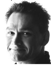
Henrik Heilmann Lederudvikling www.henrikheilman.dk