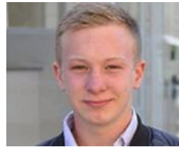
Andreas Ottosen Webbureau