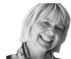
Britt Hauervig Journalistisk research www.hauervig-research.dk